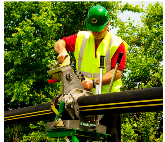
El operador utiliza una Pit Bull 26 como parte del Paquete de productividad 26, que incluye un soporte de máquina de fusión manual, la máquina de fusión 26 y dos PolyPorters.

Las Pit Bull 26 incluyen la máquina de fusión, el encarador, el calentador, el soporte del calentador con aislamiento, el soporte del encarador, el conjunto de insertos de 6" IPS y el juego de tornillos y destornilladores. Las especificaciones están sujetas a cambio sin previo aviso.